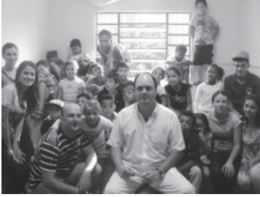
O Centro Educacional encerrou o 1º trimestre com diversas atividades