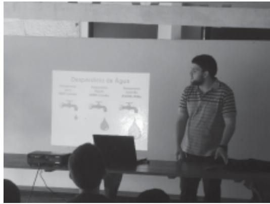
para os mais de 100 alunos atendidos diariamente no contraturno escolar.