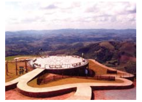
Praça do Mirante

"Mais do que máquinas precisamos de humanidade" - Charles Chaplin